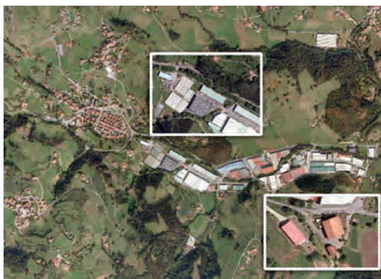
Composición sobre imagen de Google Earth en Asteasu.

Así, conecté la reseñada entrevista en Ugarte, del 2008, con dos más que había realizado en el año 2004 a miembros del personal técnico de desarrollo rural que había participado en la inauguración de la agroaldea y a una persona socia de la empresa Usagarri S.L., sita en esa agroaldea, un invernadero hidropónico de tomate label, un tipo de cultivo sin tierra al que le llegan todos los nutrientes por un sistema de goteo informatizado. En aquellos años, gran parte de los invernaderos habían sido abandonados. No obstante, para poder recalificar nuevamente ese suelo se debieron solicitar los preceptivos informes de impacto ambiental. Con lo cual, en la escenificación introduzco información oficial sobre documentación institucional relacionada con la revisión de las Normas Subsidiarias de Planeamiento de Asteasu. Finalmente, los requerimientos de los informes definitivos de impacto ambiental, junto con la carestía de recolocar el enorme invernadero hidropónico, hicieron que el ayuntamiento se decidiera a mantener esa agroaldea como separación entre el casco urbano residencial y el parque industrial de Asteasu. En la siguiente imagen, compuesta a partir de