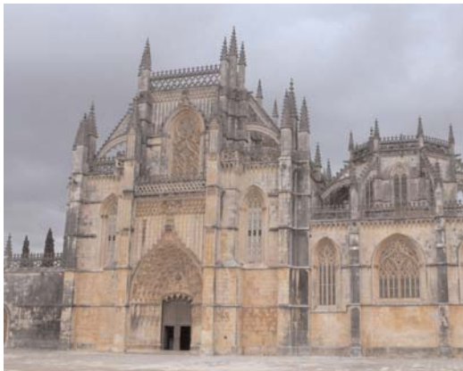
Detalle del monasterio de Batalha.