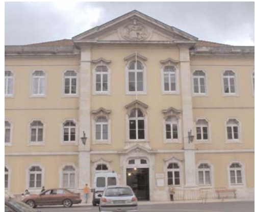
Complejo termal de Caldas da Rainha.

El Futuro de nuestros monasterios 11 . Es de esta manera como el Periódico Regional de Leiria, considerado como el periódico de la región, se refiere a una conferencia organizada en Alcobaça, entorno a los asuntos urgentes relacionados con tres monumentos inscritos en la lista del Patrimonio Mundial de la UNESCO, situados entre la Región de Leiria, la Región Oeste y Santarém (Portugal): El monasterio de Alcobaça, el Monasterio de Batalla y el Convento de Cristo en Tomar.