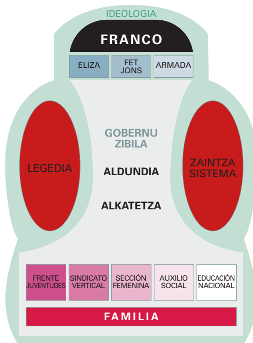
Erregimen frankistak ezarritako gizarte-egitura (Mintzberg, 1989, moldaturik) 4 .